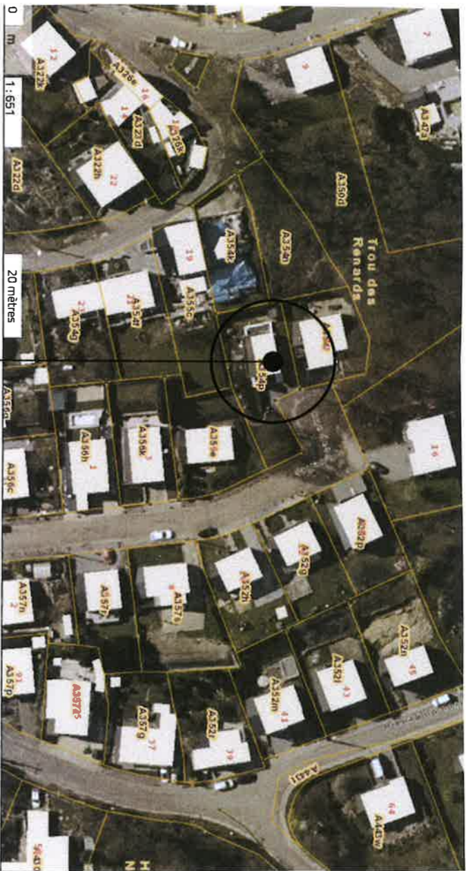
OBJET DE LA DEMANDE